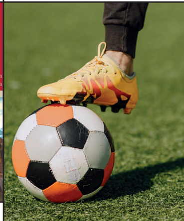
GRA W PIŁKĘ NOŻNĄ