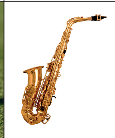
GRA NA SAKSOFONIE